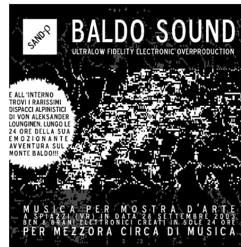
Baldo Sound, la copertina