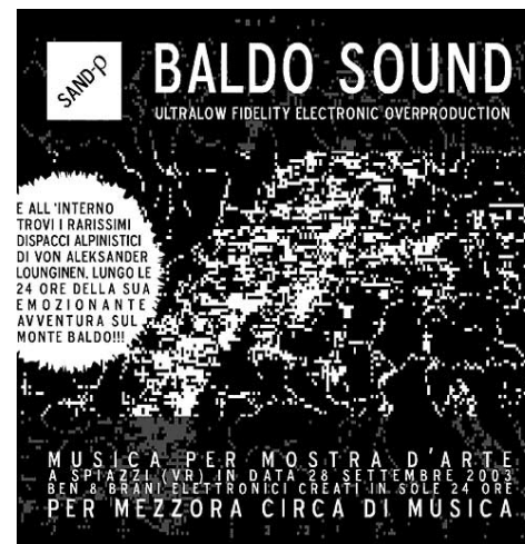
Baldo Sound, la copertina